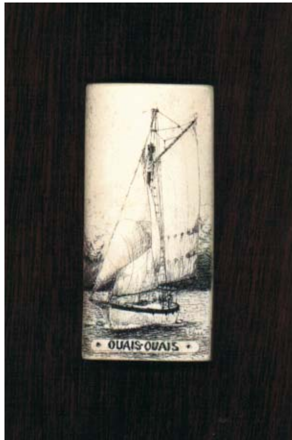
O OUAIS-OUAIS grabado en óso

De todas maneras, nuestro próximo objetivo es ir a Argentina, Sudáfrica, Pacífico y vuelta a casa, a Canadá, para hacer un museo de nuestro barco y disfrutar un poco también de tierra firme.