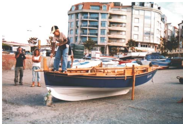
Bota abaixo da Bicoca no peirao de Portonovo

“A Bicoca”, así se chama a nova embarcación da asociación. Non podía ser outro o nome. Foi o día 18 de Agosto do ano 2006, “Día do Can” en Portonovo, o día en que as táboas desta fermosa dorna polbeira mezclaron por primeira vez o cheiro da brea e alquitrán co salitre das augas da ría de Pontevedra. Xa conta con varias travesías e regatas, e agora mesmo está a recibir as tarefas de mantemento merecidas por todo barco pra comezar unha nova tempada de navegacións. Que saiba a xente que a Bicoca está a disposición dos socios e de xente que estea interesada na navegación tradicional a vela. LONGA VIDA Á BICOCA!!!!