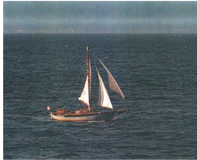
O OUAIS-OUAIS pasando polo estreito de Gibraltar

Más tarde estuvimos 3 semanas en Dinamarca y así durante 2 años recorrimos el norte de Europa. Un día, cuando navegábamos hacia Francia, "quebró una pulia" y un cabo me cortó mi dedo. ¡Uff! ¡Oh lala! Fue difícil la navegación así durante muchos días. ¡Me duele!